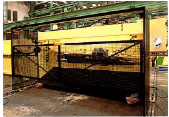
Rejilla trasera escamoteable de accionamiento manual con final de carrera.