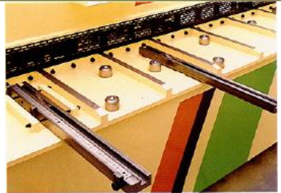
Tope de escuadra con regla milimetrada y consolas de apoyo, ambos con taquets eclinsables.